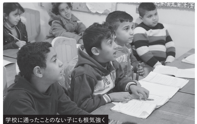
学校に通ったことのない子にも根気強く

今年の冬は例年以上に寒く、寒波や嵐の日が続きました。そんな中、ブルジバラジネキャンプで徐々に母親ワークショップを行いました。昨年はテロ事件があったりしましたが、現在は落ち着いています。参加した40名のお母さんに暮らしについて聞くと、ほとんどの家にストーブがないため非常に寒いそうです。灯油代が高いので使えないのです。「家に電気ストーブがあ