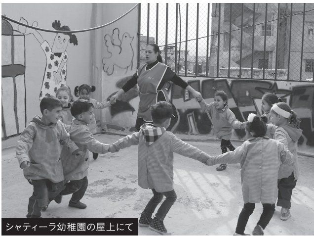
シャティーラ幼稚園の屋上にて