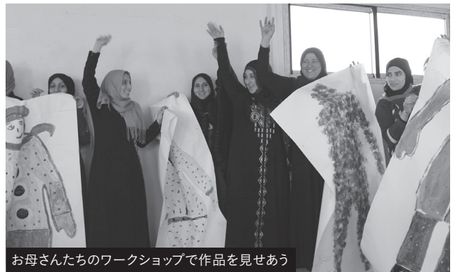
お母さんたちのワークショップで作品を見せあう

母親のワークショップでは「自分を大切にすること」をテーマにしました。2人1組になって、大きな模造紙の上に横たわって身体の輪郭線を描き、「今悲しみに沈んでいる女性に、美しい服を着せて幸せな気分になってもらおう」と彩色をします。伝統的な衣装を着せたり、スポンジを使って躍動感のある塗り方をしたりと様々な表現があり、「子どもの頃に戻ったようでとても楽しい」と、どの母親も終始笑顔です。完成後作品を並べて、互いに良いと思う点について語り合いました。シンプルな材料と手法ですが、等身大の女性を幸