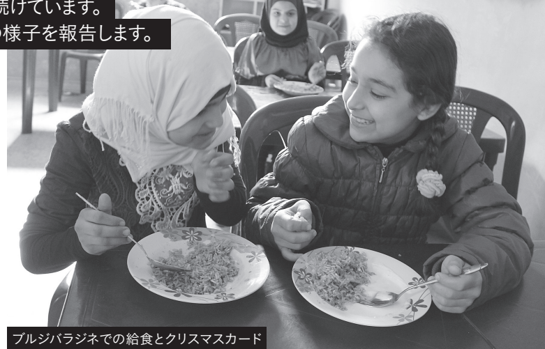
ブルジバラジネでの給食とクリスマスカード

ベイルートのブルジバラジネ難民キャンプでは11月、パリの爆弾事件の前日にやはり爆弾事件が起りましたが、幸いなことに幼稚園や補習クラスの子どもたちは、全員家族を含めて無事でした。事件から一週間後に子どもたちはクリスマスカードを制作しました。15歳の少女は「レバノンがシリアのようになってしまっているのではないかと心配しました。友だちもいるしレバノンが好きです。レバノン人も、故郷シリアの人たちと同じです。レバノン人も、シリア人も、パレスチナ人も、私たちは皆同じアラブ人なのだから、心あわせて協力しあうべきだと思う。」と語っていました。このクリスマスカードは東京での12月のイベントで参加者の皆さんにも配りました。